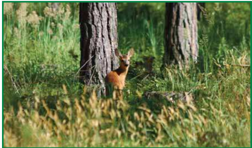
Der Wald kann viele Funktionen erfüllen – Holzfabrik und Lebensraum

Das Jahr 2011 wurde von den Vereinten Nationen zum „Internationalen Jahr des Waldes“ ausgerufen. Erklärtes Ziel ist, Bewusstsein zu schaffen bezüglich der Bedeutung funktionsfähiger Wälder und der Notwendigkeit ihrer nachhaltigen Erhaltung für heutige und zukünftige Generationen. Im wohlhabenden und hoch entwickelten Europa mag die Wertschätzung des Waldes hoch sein, weltweit stellt sich die Situation anders dar. Nach wie vor gehen jährlich 130.000 km 2 Wald durch Rodungen verloren, das ist ein und einhalbmal die Fläche Österreichs. Die Abholzung der tropischen Regenwälder ist verantwortlich für den Verlust der biologischen Vielfalt, es verschwinden nicht weniger als 100 Arten pro Tag. Man schätzt, dass bis zu 20 % der globalen, klimaschädlichen Treibhausgasemissionen auf das Konto der Entwaldung gehen. Die Gründe für diese unselige Entwicklung sind Profitgier, kurzsichtige Politik und die Not der Besitzlosen in der dritten Welt. Urwälder werden von Konzernen auf der Suche nach Edelhölzern erschlossen und geplündert, die nachfolgende Brandrodung soll Platz schaffen für Weide- und Ackerland.