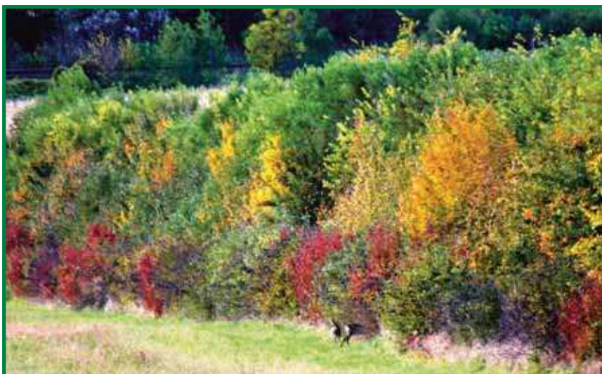
Mehrfachnutzung einer Windschutzanlage

Leiter des Landesforstdienstes im Amt der Bgld. Landesregierung