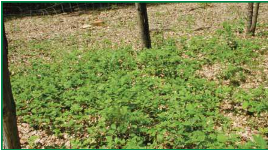
Kontrollzäune öffnen oft die Augen

Maßnahmen, die den Lebensraum der Wildtiere verbessern oder die Abschusserfüllung erleichtern, wie zum Beispiel das Schlagen von Schuss-schneisen in unbejagbare Dickungen. Leider wird von dieser Möglichkeit selten Gebrauch gemacht.