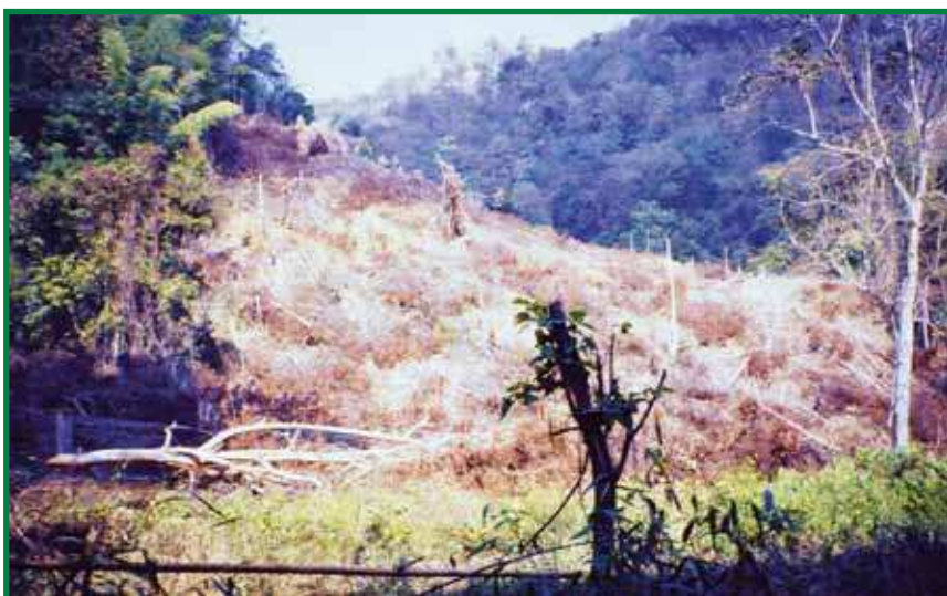
Brandrodung in Malaysia