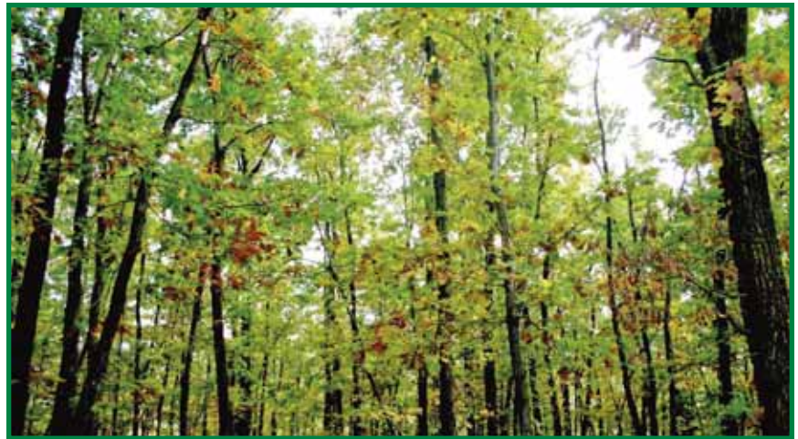
Von Natur aus würden im Burgenland Eichenwälder vorherrschen

Import und Fachhandels-Auskunft: Idl GmbH · Südbahnstr. 1 · A-9900 Lienz office@waffen-idl.com · www.blaser-r8.de