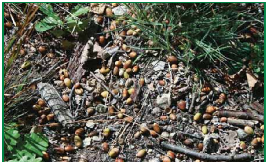
Verbiss oder Eichelverjüngung? Der Jäger entscheidet mit.

den Ressourcen der Natur umgegangen sind. Wohl niemand möchte sich einen Wald ohne Wildtiere vorstellen, ebenso wenig aber den pannonischen Wald ohne Eichen. Die Problematik des Wildverbisses an Keimlingen ist oft kompliziert und nicht sofort zu erkennen. Unsere Mitarbeiter des Landesforstdienstes sind gerne bereit, vor Ort mit den Jägern gemeinsame Begehungen durchzuführen oder Kontrollzäune zu besichtigen, um das Thema zu erörtern. Dabei steht außer Zweifel, dass die Abschusserfüllung im Laufe der letzten Jahrzehnte durch zunehmende Beunruhigungen des Wildes nicht einfacher geworden ist. Auch die Forstwirtschaft hat in vergangener Zeit durch Anlage von Fichtenmonokulturen und Ausdunkelung der Wälder örtlich zur Verschärfung der Situation beigetragen. Das aktuelle Forstgesetz erlaubt auch die Durchführung von