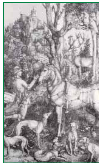
Albrecht Dürer, Eustachius Auch dieser Kupferstich von Albrecht Dürer (1471–1528), die wohl bekannteste künstlerische Darstellung der Legende überhaupt, zeigt nicht, wie oft zu lesen ist, den Heiligen Hubertus, sondern ebenfalls den Heiligen Eustachius. Hubertusdarstellungen sind in der Kunst dieser Zeit eher selten.

Die Stola des Heiligen soll im Jahre 825 bei der Überführung seiner Gebeine in das Ardennenkloster Andain, das sodann den Namen Saint Hubert trug, aus dem Schrein entnommen worden sein und gilt seit dem Verlust der sterb-