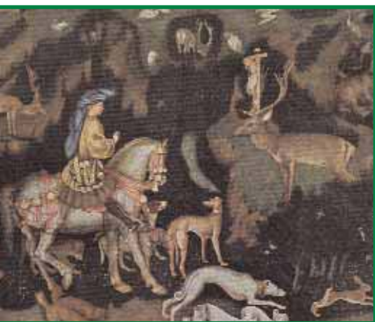
Pisanello, Eustachius In der ersten Hälfte des 15. Jahrhunderts schuf der Italiener Vittore Pisano, genannt Pisanello, dieses Meisterwerk der Frührenaissance, das die Vision des Heiligen Eustachius, begleitet von Hunden und vielerlei Getier, darstellt.

Erst frühestens im 15., wenn nicht gar erst im 16. Jahrhundert gewinnt der Heilige Eustachius eine Bedeutung für die jagende Zunft und in Bayern und vor allem in Österreich nimmt er, dessen Gedenktag der 20. September ist, noch heute vielfach die Stelle des Hubertus als Schutzpatron der Jäger ein.